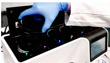
Systeme fermé et sécurisé