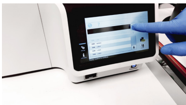
Protocoles de coloration pré-programmés

La RAL StainBox est un système fermé qui doit être utilisé avec les kits de coloration associés. La formulation des réactifs est sans méthanol, réduisant ainsi l'exposition des membres du personnel aux substances chimiques toxiques. Par ailleurs, ils sont prêts à l'emploi, évitant au personnel de devoir mélanger ou diluer les réactifs. Chaque kit permet de colorer jusqu'à 300 lames pendant 28 jours après son ouverture.